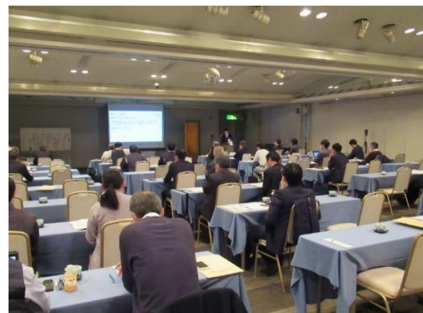
写真 3 会場の様子