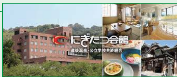
にぎたつ会館ホームページより